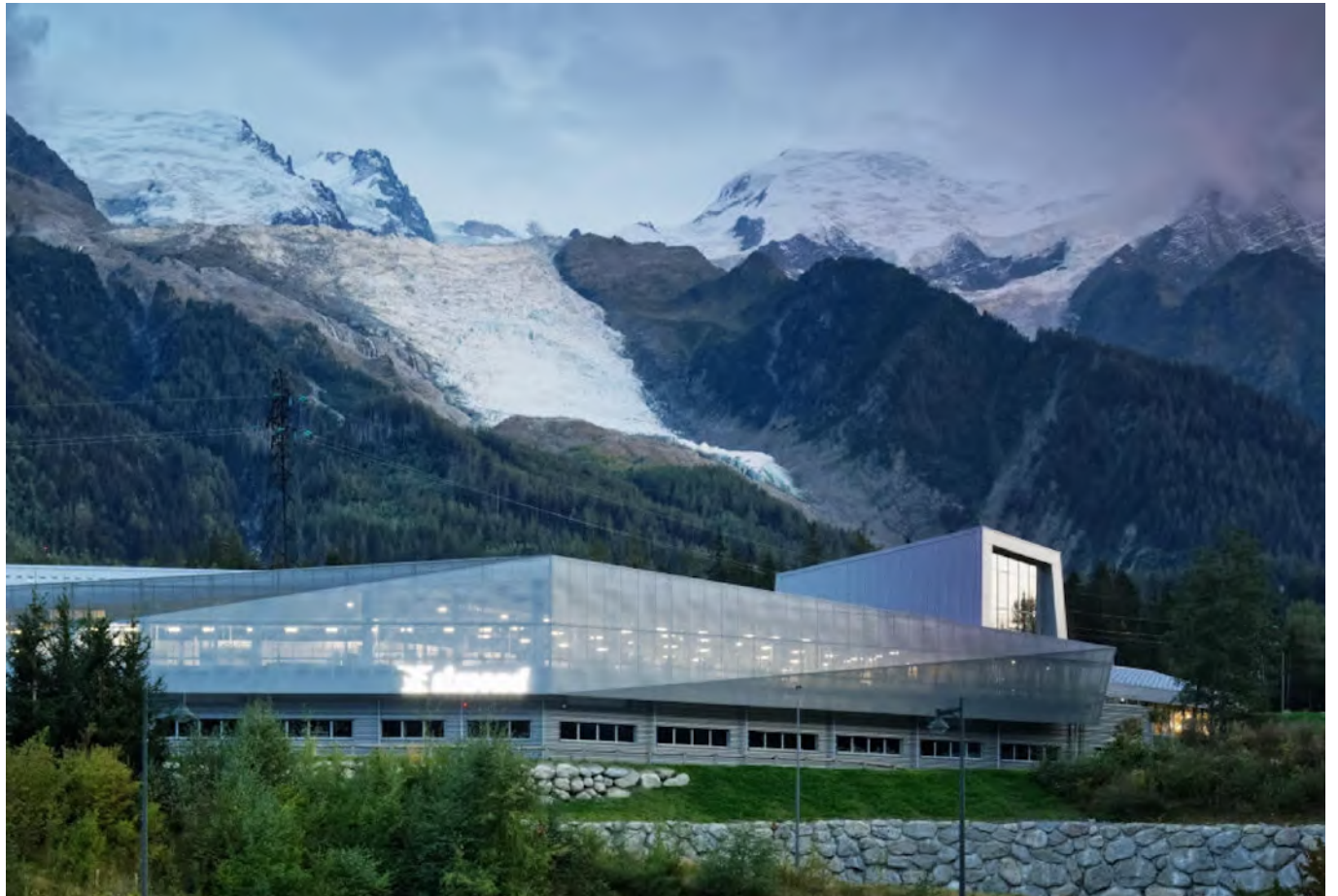
LE BASE CAMP

Du premier atelier aux Bossons jusqu'à aujourd'hui, Simond a toujours ancré son savoir-faire au cœur du Mont-Blanc.