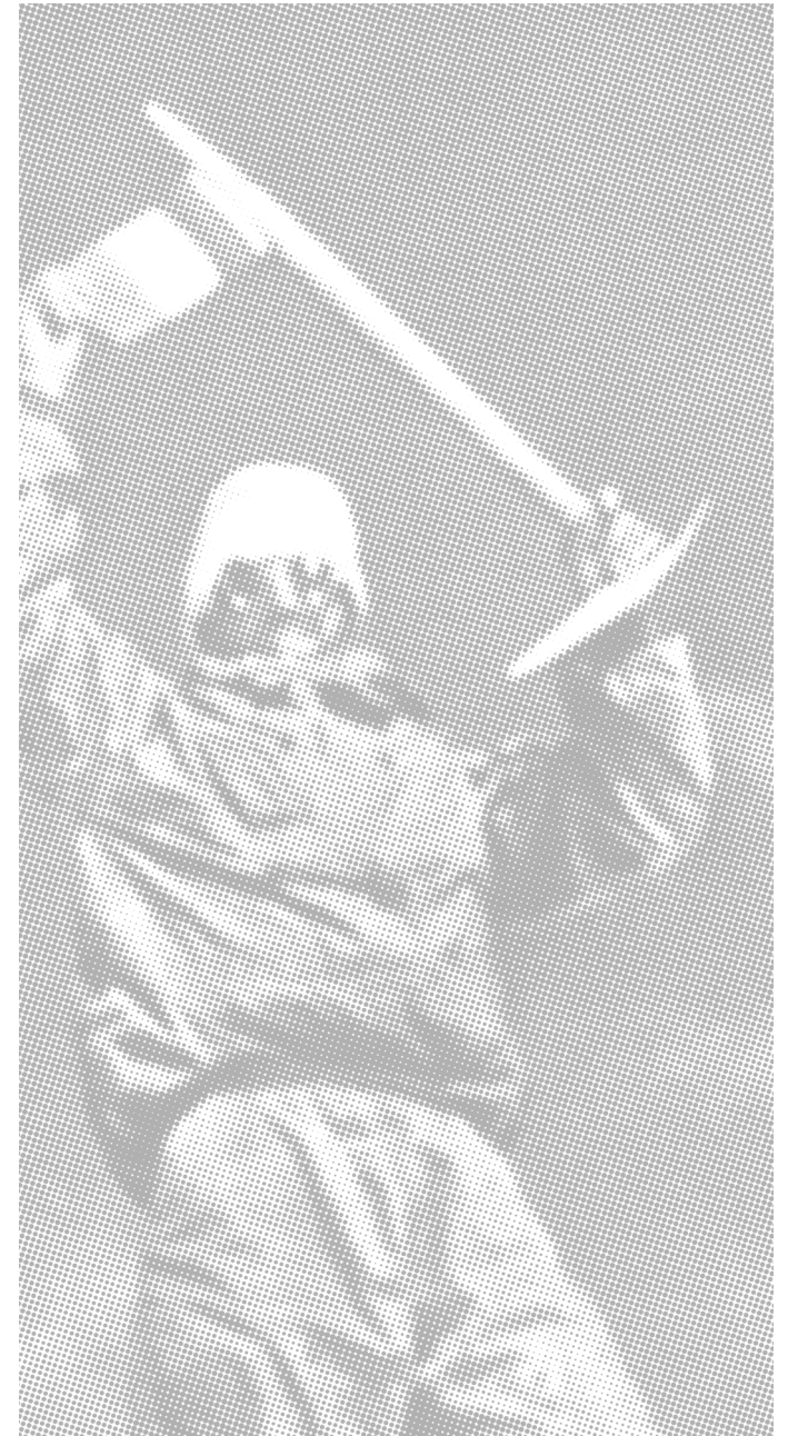
ANAPURNA FIRST ASCENT MAURICE HERZOG 1950

Dans les mains et sous les pieds de nombreux alpinistes, la signature Simond a accompagné les exploits d'hier... et continue d'inspirer ceux de demain.