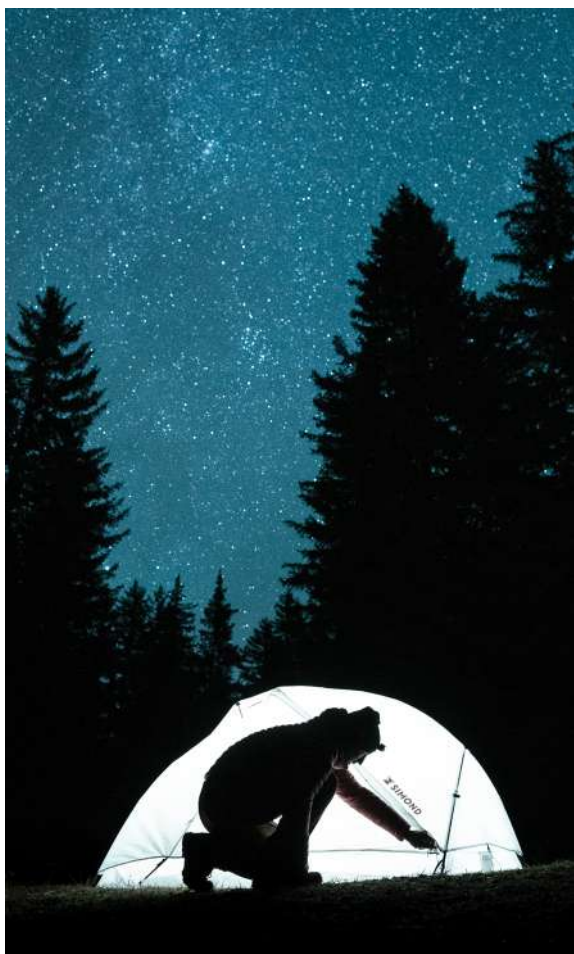
ZOOM SUR LA TECHNIQUE « UNDYED »

Le "undyed" (ou non teint) désigne la couleur naturelle du tissu, tel qu'il est à l'état brut, sans ajout de pigments. C'est une solution simple, visible et particulièrement efficace mais qui ne peut pas s'appliquer à toutes les typologies de produits, notamment pour des raisons techniques, esthétiques ou de durabilité des coloris.