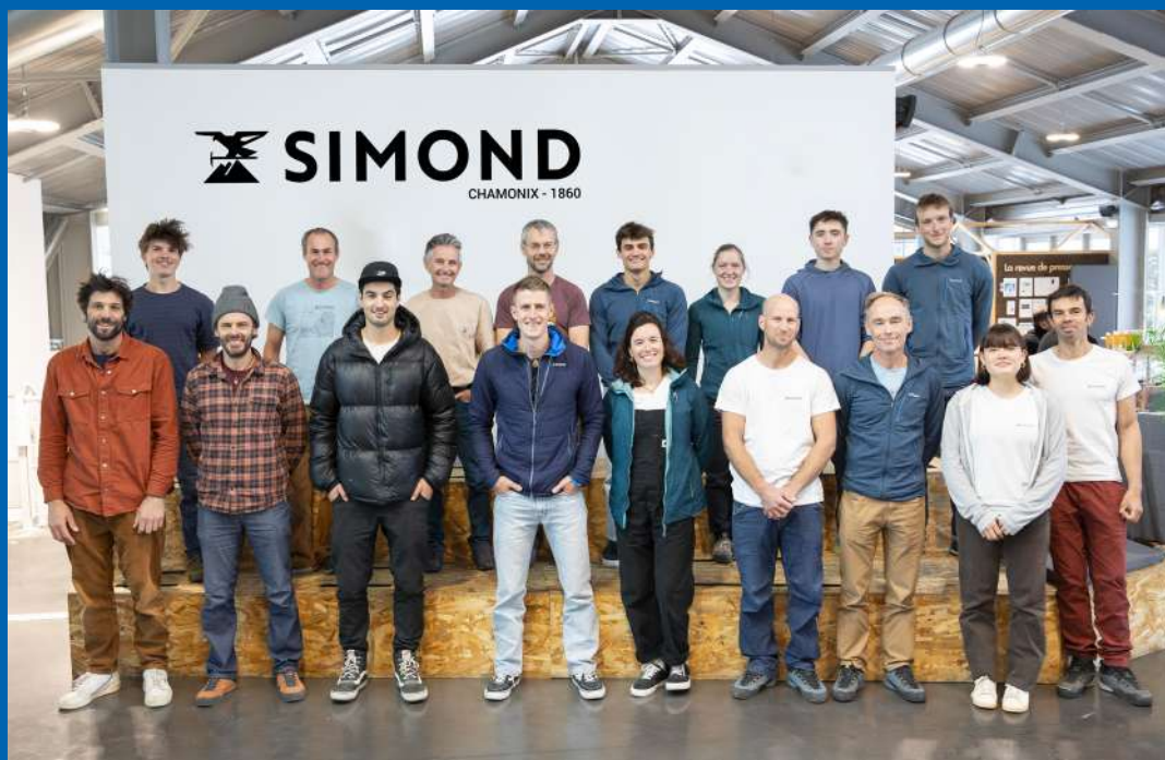
TEAM SIMOND, L'EXCELLENCE PLURIELLE