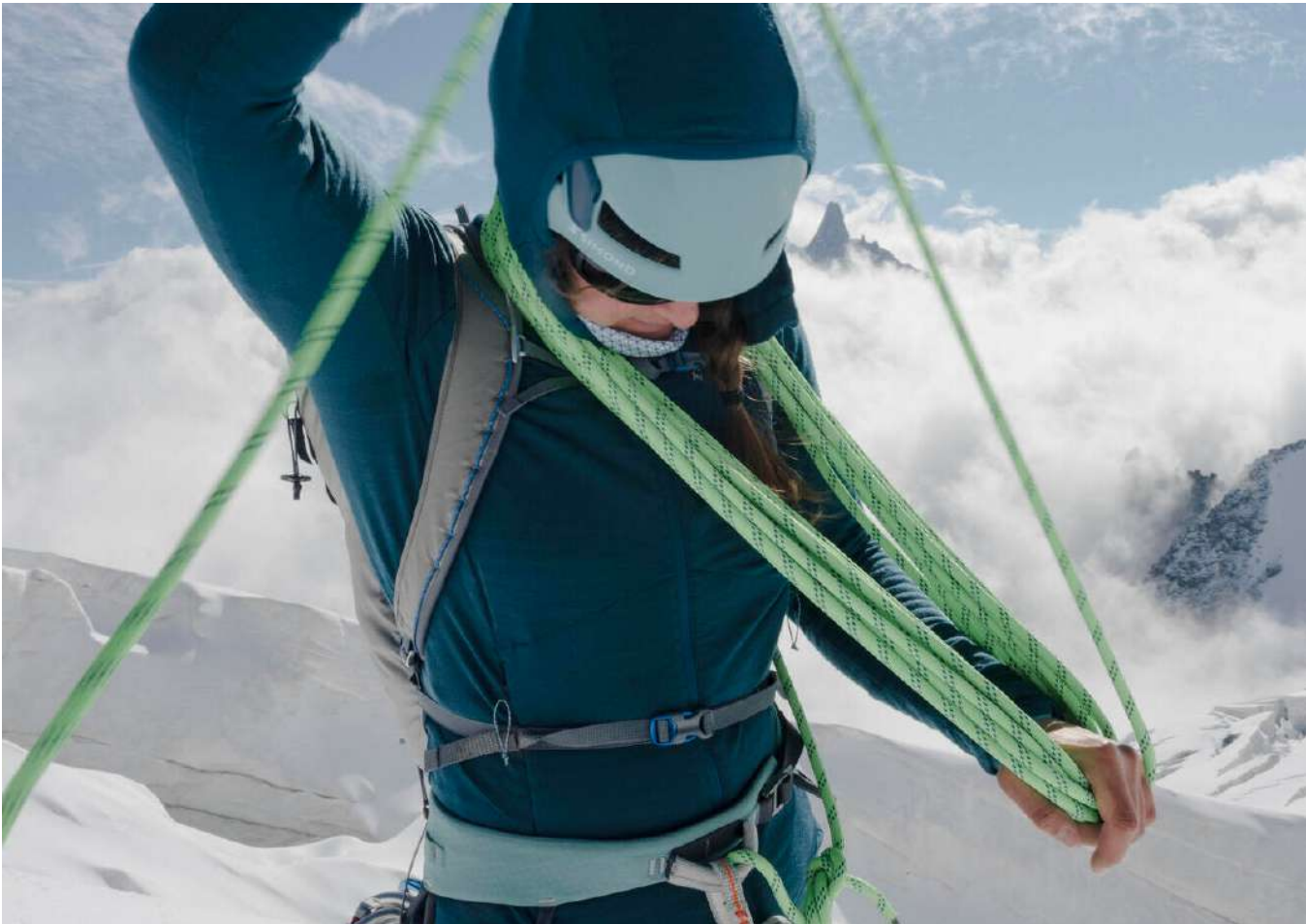
ZOOM SUR LA TECHNIQUE « DOPE DYED »

La teinture est l'une des étapes les plus impactantes du cycle de vie d'un produit textile.