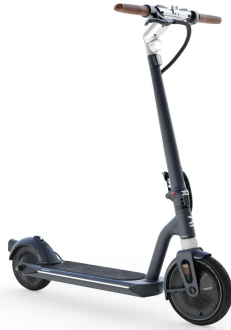
CODE MODÈLE : 8577081

Vous êtes concernés par cette note d'information.